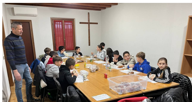
Ore 7:20 Preghiera ragazzi medie