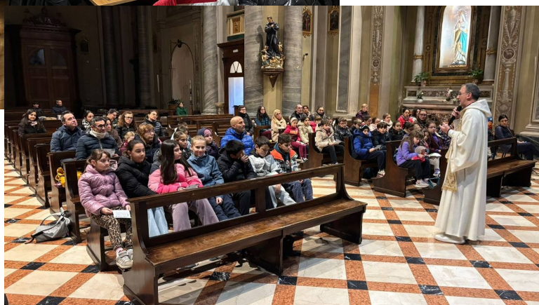
Ore 8:05 Preghiera bambini elementari