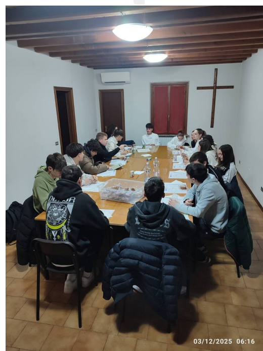
Ore 6:05 Preghiera ado e giovani