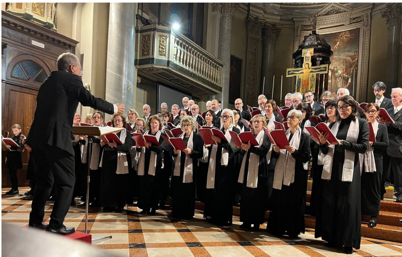
Concerto “Veni Domine” della nostra corale domenica 21 dicembre